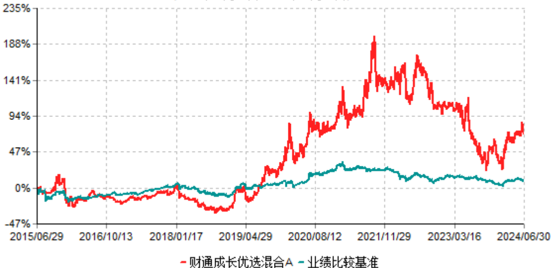
财通成长优选混合A累计净值增长率与业绩比较基准收益率历史走势对比图 (2015年06月29日-2024年06月30日)